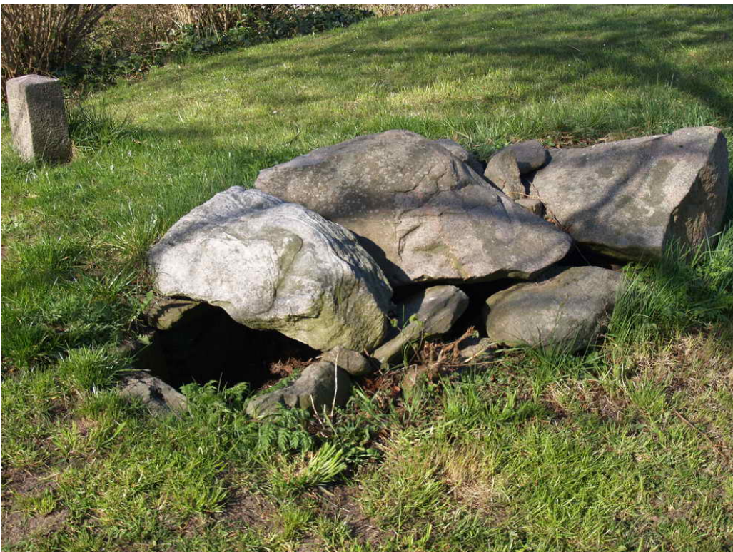
Hellekisten med 3 dæksten og 11 sidesten.